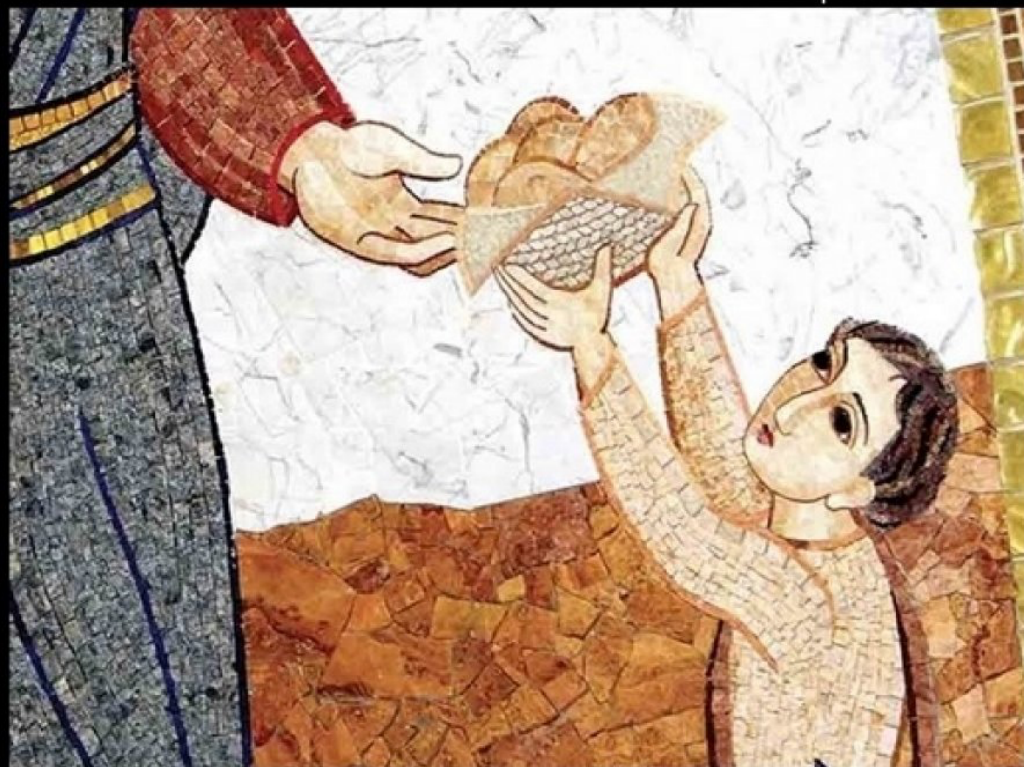
Tavola interconfessionale -Atti 2,41-47